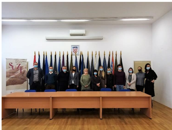
Sastanak projektnog tima

Stručne radionice održali smo u svakoj partnerskoj organizaciji sa njihovim zaposlenim ženama, koordinatorima i kontrolorima.