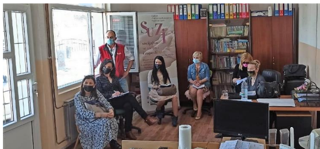
Stručna radionica potpore zaposlenim ženama

Na radionicama se razgovaralo i o dosadašnjem radu zaposlenih žena na poslovima pomoći u kućanstvu i njihovom zadovoljstvu zaposlenjem kroz projekt.