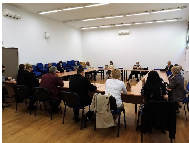
Stručna radionica potpore zaposlenim ženama

Nakon stručnog dijela, na svim radionicama projektni tim Grada Zagreba ukratko se dotaknuo operativnih pitanja provedbe aktivnosti projekta u vidu distribucije zaštitne opreme i higijenskih potrepština, koje se redovito naručuju i distribuiraju sukladno iskazanim potrebama projektnih partnera, te pripreme radnje za fazu II provedbe projekta SUZI.