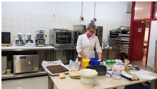
Praktični dio nastave u okviru obrazovnih programa iz područja poljoprivrede i prehrane

Podloga je to našim ženama da budu konkurentnije na tržištu rada i nakon završetka ovog projekta.