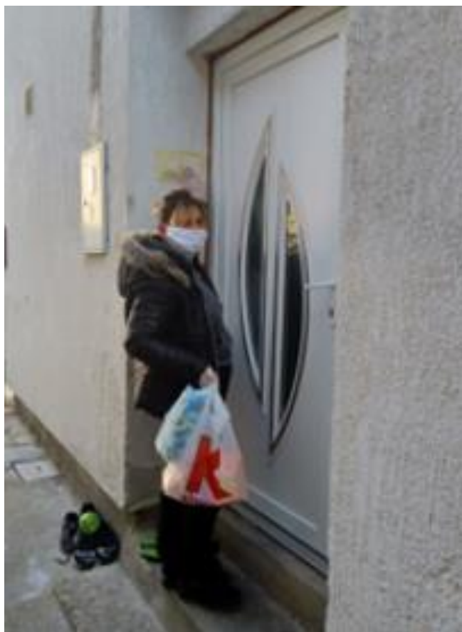
Naše zaposlene žene za vrijeme lockdowna

Vodeći računa o zaštiti vlastitog zdravlja, ali i zdravlja i potreba onih o kojima skrbe, zaposlene žene kontinuirano su obavljale svoja radna zaduženja sukladno mjerama i preporukama nadležnih tijela i institucija kako se niti jedan korisnik ne bi osjećao uskraćenim za bliskost i solidarnost.