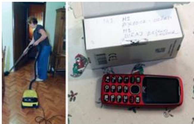
Radna zaduženja zaposlenih žena i pomoć u snalaženju s modernom tehnologijom