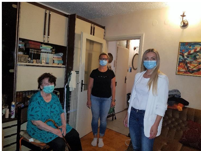
Nadzor nad izvršenjem projektnih aktivnosti na terenu

Pored redovite telefonske komunikacije sa zaposlenicama, kontrolori partnerskih organizacija odlaze i u povremene posjete kod krajnjih korisnika. Pokazalo se kako je to dobar put da se na neposredan način osigura kvalitetna provedba projekta te riješe eventualne nejasnoće.