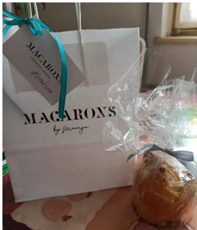
Macarons s hashtagom #ostanidoma

Uz poruku „Ostani doma, mi smo tu za tebe“, našim korisnicima poručili smo da mislimo na njih, brinemo o njima i činimo sve kako bi naš zajednički projekt u ovim teškim vremenima opravdao svoj glavni cilj i ideju, a to je prije svega humanost.