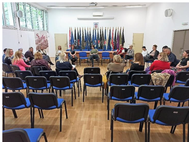
Stručna radionica za potporu zaposlenim ženama

Bilo je divno vidjeti ozbiljnost i predanost tih žena poslu i krajnjim korisnicima. Na početnim radionicama djelovale su pomalo prestrašeno, a sada već sa sigurnošću možemo reći kako su ovladale situacijom i međusobno razmjenjuju iskustva kako bi još bolje obavljale posao.