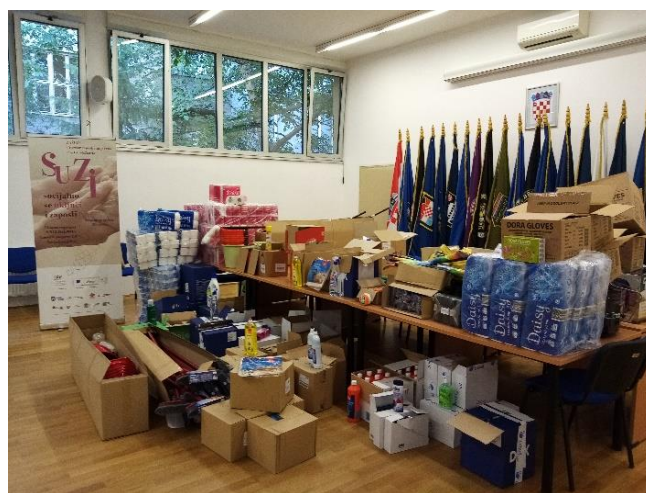
Distribucija higijenskih potrepština projektnim partnerima

U okviru provedbe projekta Grad Zagreb sklopio je ugovor o nabavi higijenskih potrepština koja se naručuju i isporučuju sukladno iskazanim potrebama projektnih partnera, a koordinatori i kontrolori partnerskih organizacija organiziraju distribuciju na terenu.