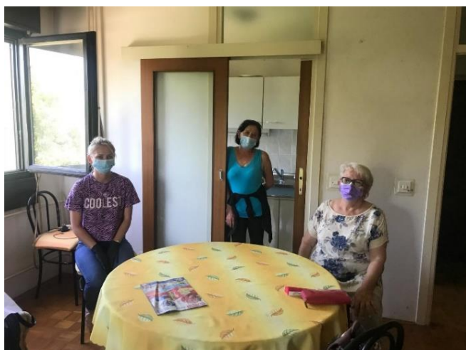
Nadzor nad izvršenjem projektnih aktivnosti na terenu

U okolnostima epidemije Covid-19, uz prilagodbu rada novonastalim okolnostima, krajnjim korisnicima je vrlo važna poruka kako se projekt nastavlja i dalje.